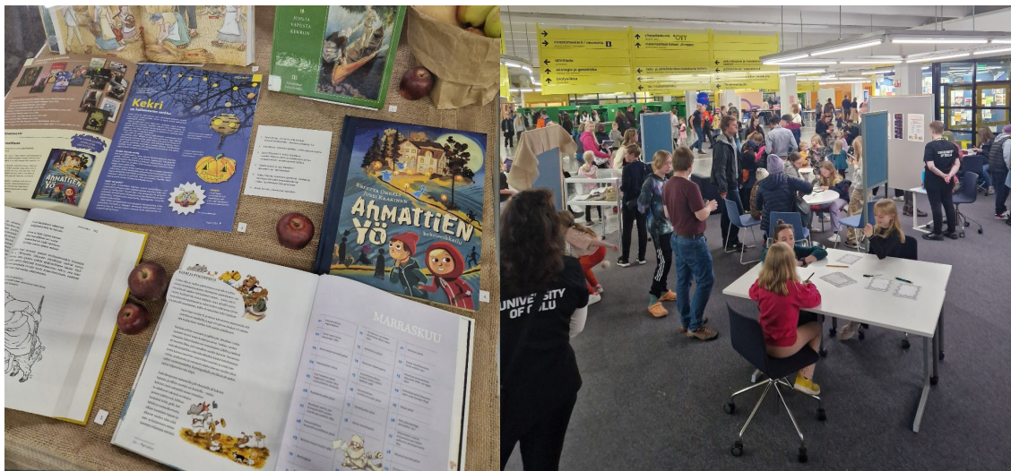
Tutkijoiden yön tunnelmia ja yksityiskohtia kirjaston pisteeltä.

Koko perheen vuotuinen tiedetapahtuma Tutkijoiden yö valtasi Oulun yliopiston Linnanmaan kampuksen 29.9. Kirjasto oli tänä vuonna mukana teemalla ”Kurkistuksia kekriperinteeseen”. Kirjaston pisteellä vierailijat pääsivät tutustumaan muinaiseen suomalaiseen sadonkorjuujuhlaan muun muassa loitsutyöpajan, kekriaiheisen tietokilpailun sekä poistokirjoja hyödyntävien askartelujen kautta. Kirjanäyttelyssä oli esillä kekriperinteeseen liittyvää kirjallisuutta kirjaston kokoelmista.