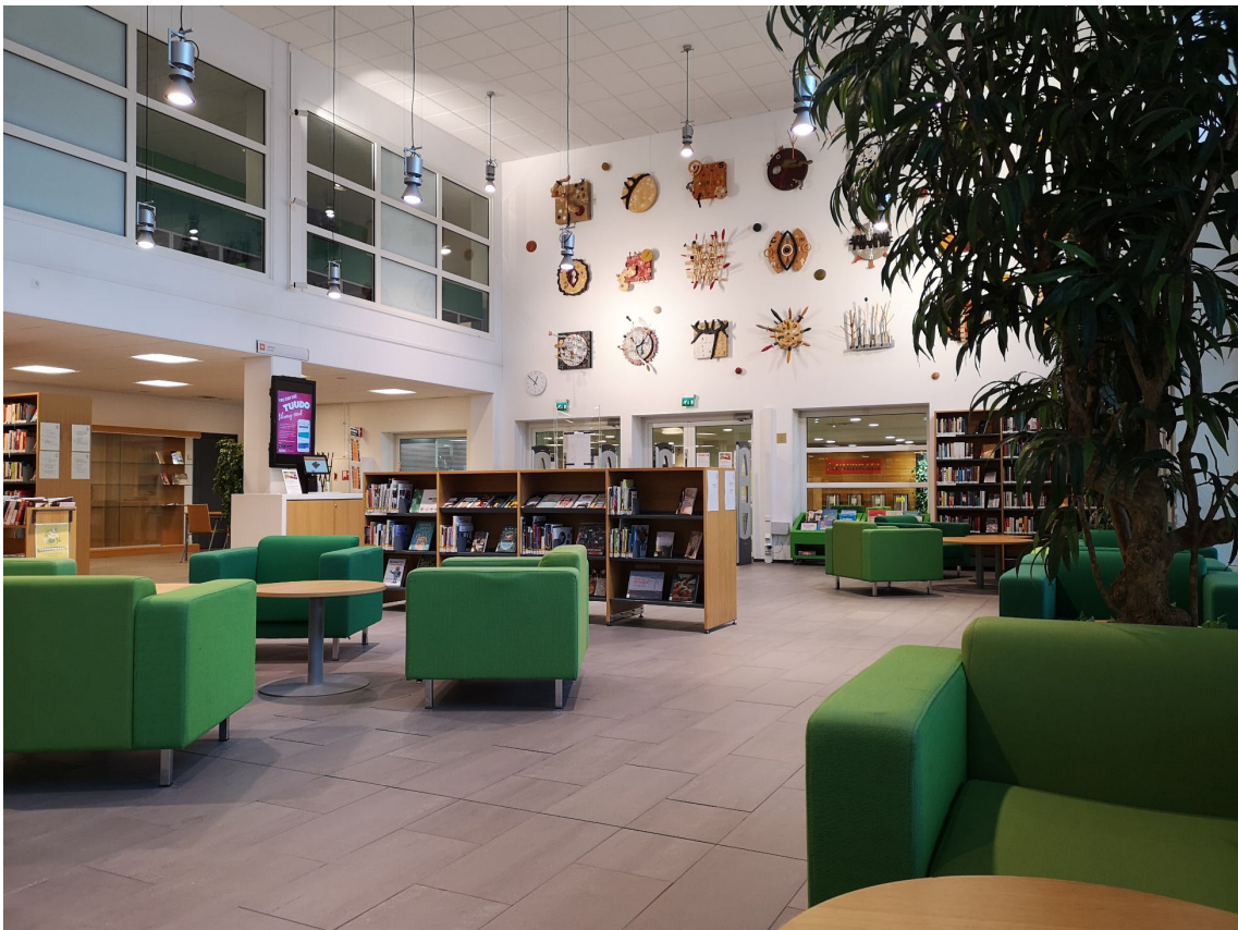
Sosiaali- ja terveysalan kirjasto