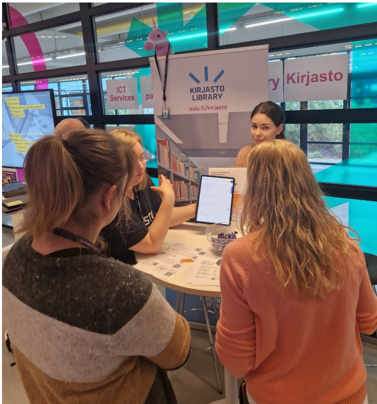
Kirjaston esittelyä Tervetuloa Oulun yliopistoon pop up -tapahtumassa.

Kirjaston henkilökunta jalkautui vuoden aikana monenlaisiin tapahtumiin esittelemään kirjaston palveluita ja tietoaineistoja. Kirjastoissa ajankohtaiset aineistonäyttelyt houkuttivat tutustumaan kirjaston kokoelmiin. Tiedekirjasto Pegasuksen vitriininäyttelyt ja Maisemasalin vaihtuvat taidenäyttelyt tarjosivat myös virkistämishetkiä kirjaston asiakkaille.