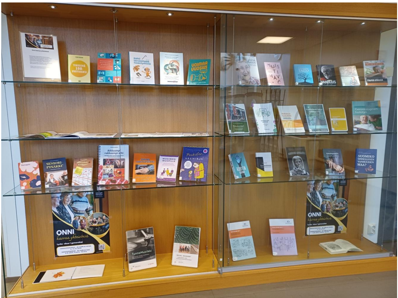
Vanhustenviikon teemanäyttely oli esillä Sosiaali- ja terveysalan kirjastossa lokakuussa.

Tiedekirjasto Pegasuksen Maisemasalin vaihtuvat ulkopuolisten tekijöiden näyttelyt päätettiin lopettaa vuoden alussa, koska opiskelijoiden suosima tila haluttiin rauhoittaa opiskelukäyttöön. Maisemasalin seinille on myös sijoitettu Oulun yliopiston taidekokoelmista pysyvä ripustus, jota jouduttiin toistuvasti siirtämään vaihtuvien näyttelyiden tieltä. Näyttelytilan kysyntä on myös vähentynyt Linnanmaan kampukselle hiljattain perustetun uuden vaihtuvien näyttelyiden tilan myötä.