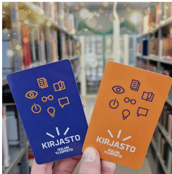
Uudesta kirjastokortista on käytössä kaksi väriversiota.

Kirjaston sähköisten korttivaihtoehtojen rinnalla käytössä oleva muovinen kirjastokortti kaipasi visuaalista päivitystä, joten kirjaston viestintäryhmässä päätettiin toteuttaa kirjastokortin ulkoasun uudistus. Pitkään palvelleesta Tiedekirjasto Pegasuksen kuvasta kortin kuvapuolella päätettiin luopua, koska sama kortti on käytössä Pegasuksen lisäksi muissakin kirjaston toimipaikoissa. Myös kortin tekstisisältöä päivitettiin.